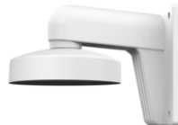
DS-1273ZJ-135 Настенный кронштейн